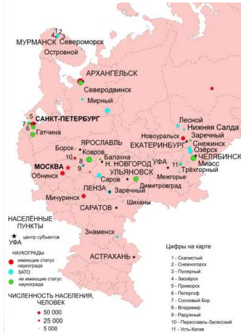
Рис. 1.2. Наукограды европейской части России (составлено автором)