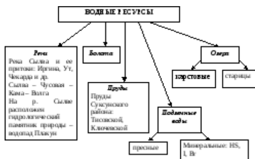
Рис. 3.7. Водные ресурсы Суксунского муниципального района Пермского края (составлено автором)