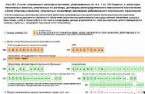
Рис. 4. Лист ЖЗ

Переходим к заполнению Листа ЖЗ - Расчет социальных налоговых вычетов, установленных пп. 4 п. 1 ст. 219 Кодекса, в части сумм пенсионных взносов по договору (договорам) негосударственного пенсионного обеспечения и (или) страховых взносов, уплаченных по договору (договорам) добровольного пенсионного страхования. Известно, что Анастасия Андреевна перечисляла денежные средства НПФ «Лукойл-Гарант», в размере 50 000 руб. за 2019 г. По строке 010 (Признак договора) необходимо указать «1», так как Солнцева уплачивала денежные средства за себя. По строкам 020-060 заполняются сведения о негосударственном пенсионном фонде. В строку 070 (общая сумма пенсионных взносов, внесенных в налоговый период) указываем 50 000 руб. Сумма пенсионных взносов, принимаемая к вычету (строка 080), составляет 13 % от суммы пенсионных взносов, внесенных в данный период. Она составит 50 000 руб. x 13 % = 6500 руб. При произведении расчета эта сумма отражена по строке 100 - общая сумма пенсионных взносов, принимаемая к вычету (рис. 4).