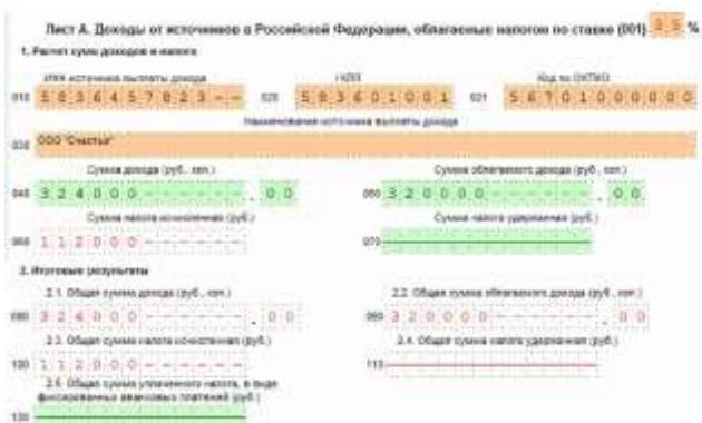
Рис. 5. Лист А (2)

При получении дохода в виде выигрыша (автомобиль DaewooMatiz) Солнцева обязана заполнить лист А (2). Доходы от источников в Российской Федерации, облагаемые налогом по ставке 35 % (ее необходимо выбрать самостоятельно, руководствуясь п. 2 ст. 224 НК РФ). По строкам 010-030 заполняется информация об источнике выплаты дохода (ООО «Счастье»). По строке 040 отразим сумму выигрыша, равную 324 000 руб. Сумма облагаемого дохода, которую заносим в строку 050 равна 320 000 руб. (так как в соответствии с п. 28 ст. 217 НК РФ стоимость подарков до 4000 руб. налогом не облагается). При расчете по строке 060 отражена сумма исчисленного налога, равная 112 000 руб. (рис. 5).