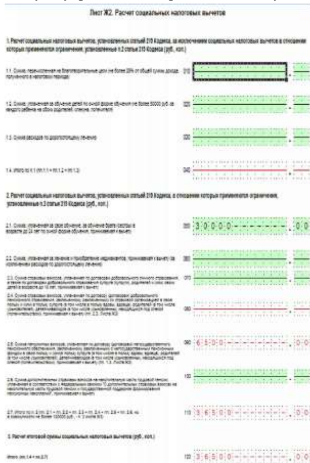
Рис. 3. Лист Ж2

По условию задачи известно, что Солнцева оплачивает свое обучение по заочной форме. В соответствии с п. 2 ст. 219 налогоплательщик имеет право получить социальный вычет на свое обучение в размере фактически произведенных расходов (но не более 120 000 руб.), т.е. по строке 050 отражаем сумму фактических расходов на обучение, равную 30 000 руб.