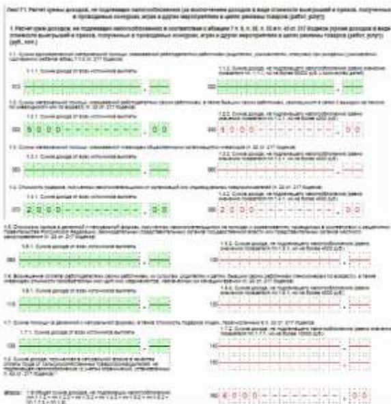
Рис. 2. Лист Г1

Далее переходим к заполнению Листа Ж2 - Расчет социальных налоговых вычетов.