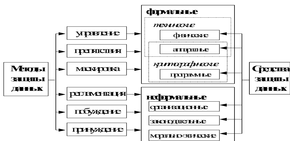
Рис. 1 Классификация методов и средств защиты данных.

Рассмотрим кратко основные методы защиты данных. Классификация методов и средств защиты данных представлена на рис. 1.