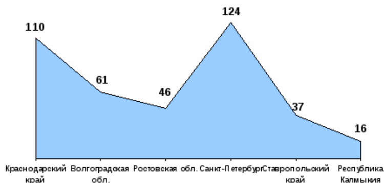
Рисунок 1 – Сведения о количестве учреждений социального обслуживания семьи и детей