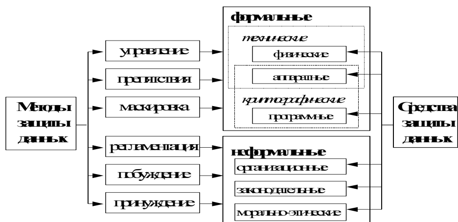
Рис. 1 Классификация методов и средств защиты данных.

Рассмотрим кратко основные методы защиты данных. Классификация методов и средств защиты данных представлена на рис. 1.